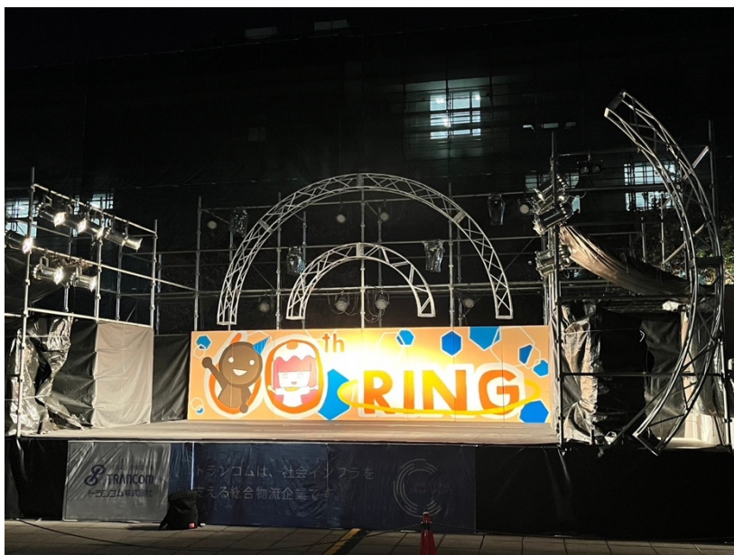
図 2 参考資料 2号館前ステージ (第60回)